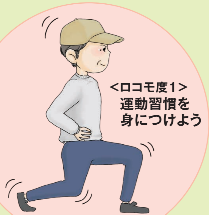
<ロコモ度1> 運動習慣を 身につけよう