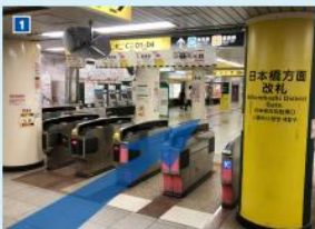
浅草線日本橋駅「日本橋方面改札」を出てそのまま直進。