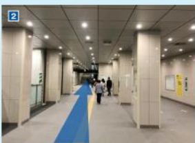
200mほど地下通路を通みます。