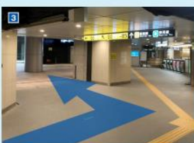
B6 出口への案内に従い直進し、東京日本橋タワー内へ入ると、正真正手奥にベルサール東京日本橋の入口があります。